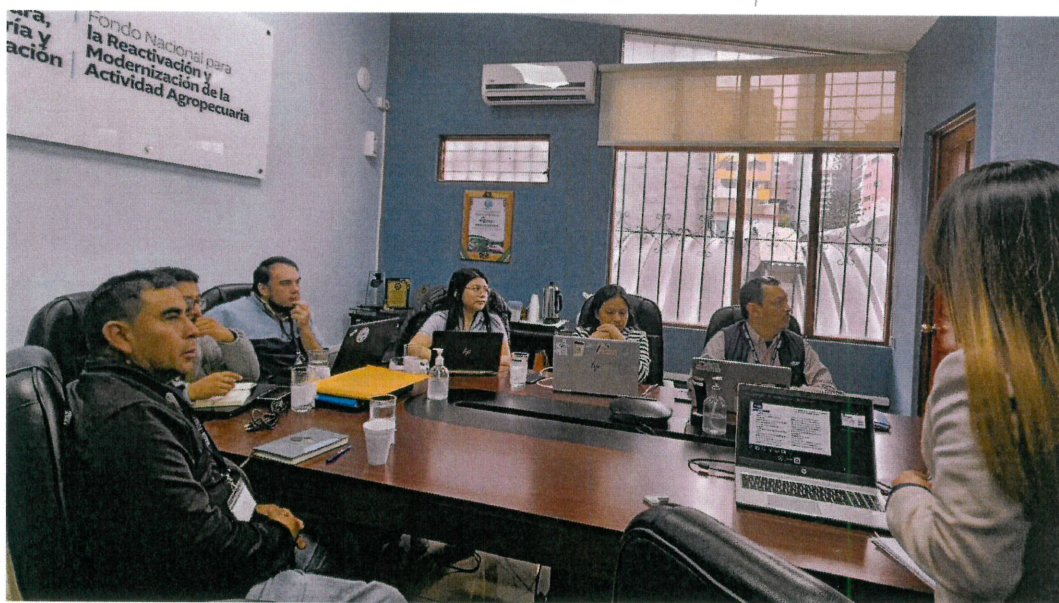
Figura 1. Asociación FECCEG en la inducción sobre la Ley de Contrataciones, uso de Guatecompras y elaboración de informes mensuales.