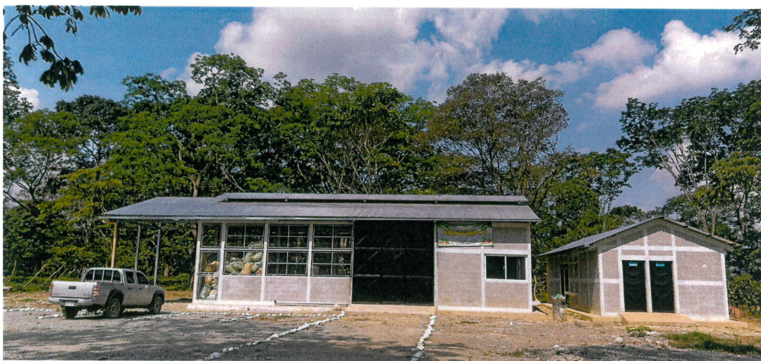
Figura 2. Asociación ASOPOMBAAQ con la infraestructura productiva implementada con aporte financiero del primer desembolso otorgado por FONAGRO en el 2023